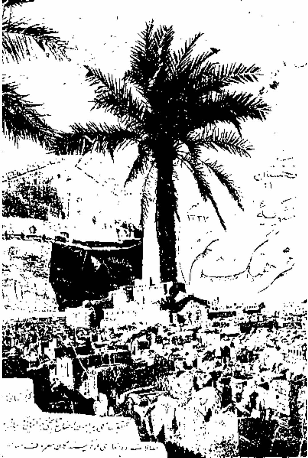
تخت جمشید کی دیواروں پر کتب و نقوش کی ایک دلنشین تصویر اٹلانٹس اور تھامس کی مورتیں۔ ان کی معرفت معلوم